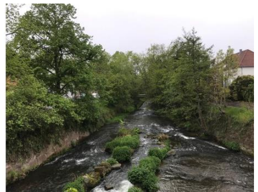
Abb. 1: wasserwirtschaftliche Aufgaben